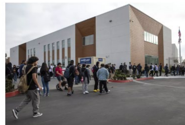
Students head to the first day of school at the Logan Memorial Education Campus in August in San Diego.

EDUCATION Fewer California, San Diego County students passed state exams in spring under weight of pandemic